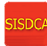
Immagine corporea nel disagio 23-24 Novembre 2012