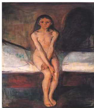
Edvard Munch, Pubertà– 1895